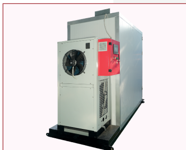
Phòng sấy Panel