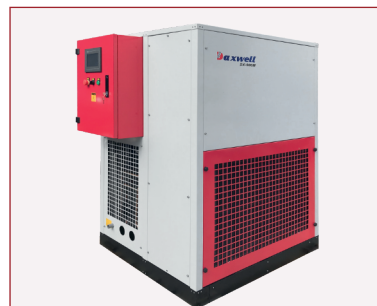
Máy sấy Daxwell